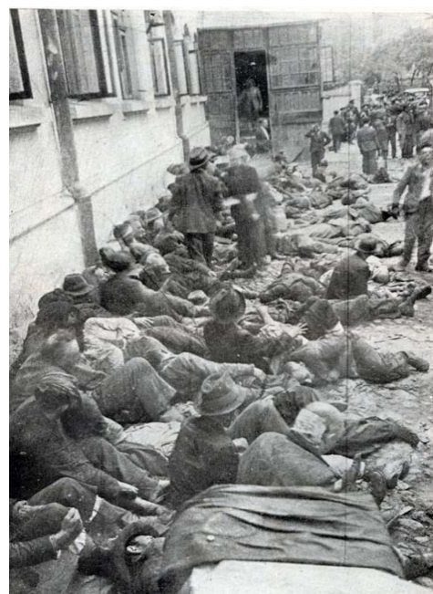
Evreii masacrați la Chestura Iași