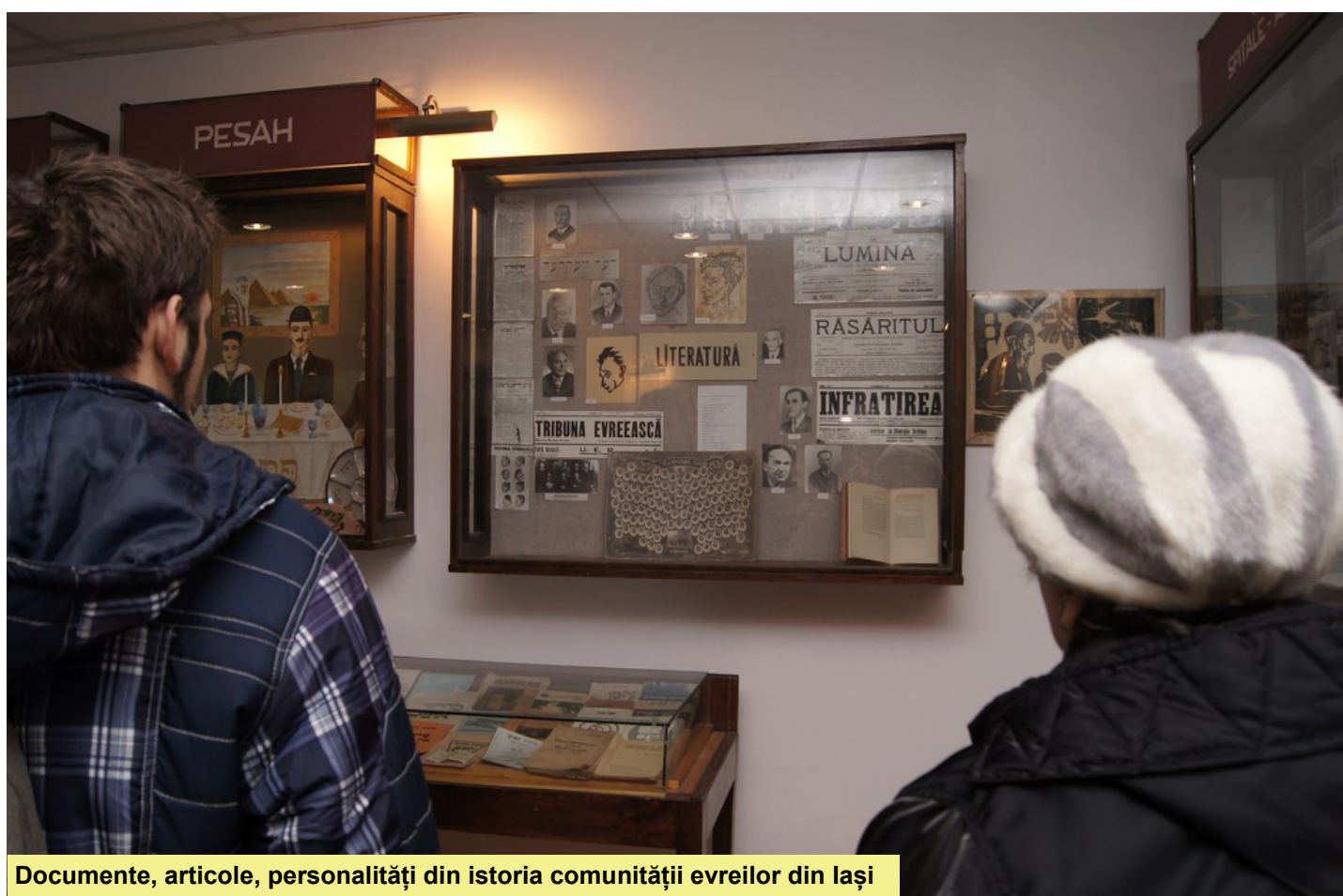
Documente, articole, personalități din istoria comunității evreilor din Iași