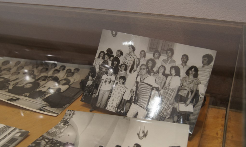
Documente, articole din istoria comunității evreilor din Iași