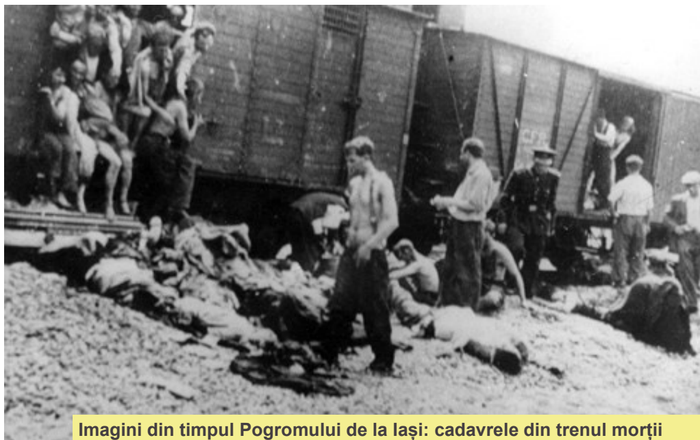
Imagini din timpul Pogromului de la Iași: cadavrele din trenul morții

Odată ce voi fi la putere, prima și cea mai importantă treabă a mea va fi anihilarea evreilor. Imediat ce voi avea puterea să fac asta, am să construiesc rânduri de spânzurători - în Marienplatz în München, de exemplu - cât de multe permite traficul. Apoi evreii vor fi spânzurați fără discriminare, și vor fi lăsați acolo până încep să se împrăști; vor rămâne spânzurați acolo atâta timp cât permit principiile igienei. Imediat ce sunt dezlegați, vor fi agățați următoarea tranșă de evrei, și tot așa, până când și ultimul evreu din München va fi exterminat. Alte orașe vor proceda la fel, exact așa, până când toată Germania va fi curățată de evrei.