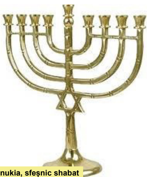
Hanukia, sfeșnic shabat

În decembrie, când creștinii sărbătoresc Crăciunul, evreii sărbătoresc HANUKA sau Sărbătoarea luminii. Este o sărbătoare minoră, în timpul căreia munca și alte activități nu sunt inter-