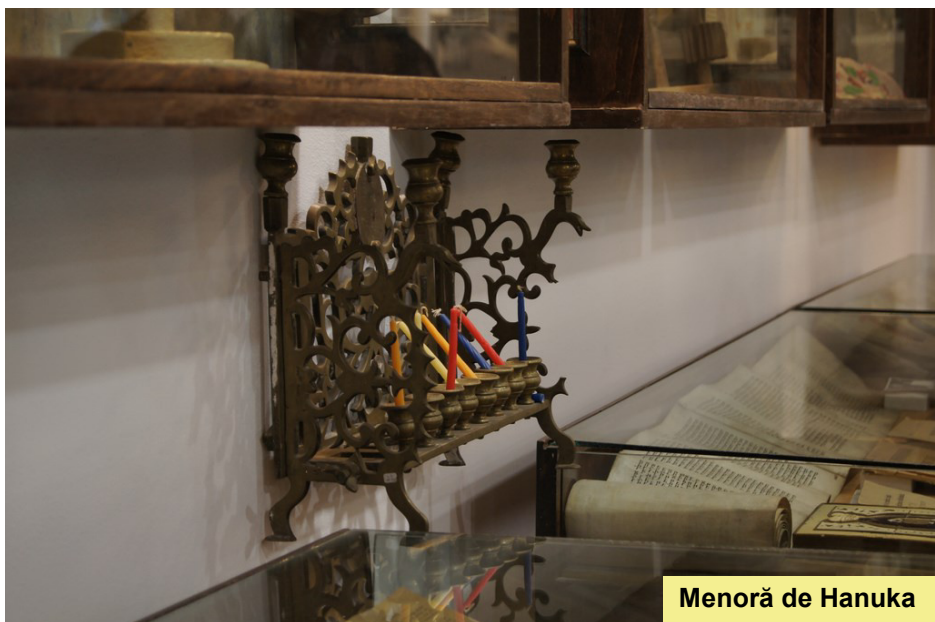
Menoră de Hanuka

În vitrinele de perete ale muzeului sunt expuse diferite scene și