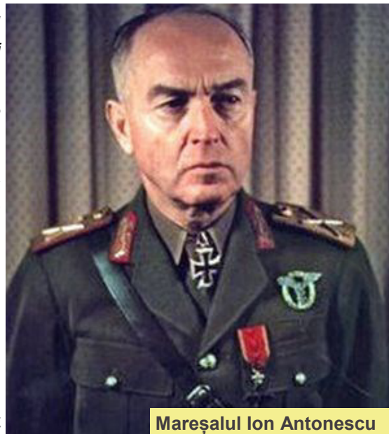
Mareșalul Ion Antonescu

„Curățirea terenului” a fost numele de cod folosit de regimul antonescian ca echivalent al termenului german „soluția finală”. Ordinul de curățirea terenului , de deportare și de exterminare a evreilor din Basarabia și Bucovina a fost dat de Antonescu din proprie inițiativă și nu sub presiuni germane. Pentru punerea în aplicare a acestei sarcini, el a ales armata și jandarmeria (Inspectoratul General al Jandarmeriei, de sub comanda generalilor Constantin Piki Vasiliu, comandant al Jandarmeriei (1940 - 23 august 1944) și Subsecretar de Stat la Ministerul de Interne (condamnat la moarte și executat pentru crime de război) și Constantin Tobescu), în special administrația civilă a armatei, pretoratul. Armata a primit „ordine speciale” prin generalul Șteflea, executorul acestor ordine fiind Marele Pretor al Armatei, generalul Ioan Topor. Șeful Marelui Stat Major al Armatei, generalul Iosif Iacobici, a ordonat comandantului Biroului 2, locotenent—colonelului Alexandru Ionescu, să pună în aplicare un plan „ pentru înlăturarea elementului iudaic de pe teritoriul basarabean prin organizarea și acționarea de echipe, care să devanseze trupele române ”. Planul a fost pus în aplicare începând cu 9 iulie 1941. Jandarmeria a primit ordinul de curățire a terenului cu trei-patru zile înainte de trecerea Prutului (21 iunie 1941), în trei locuri diferite din Moldova: Roman, Fălticeni și