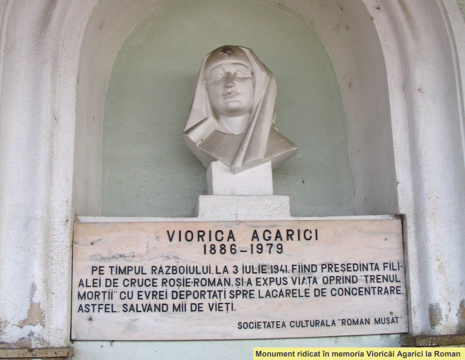
Monument ridicat în memoria Vioricai Agarici la Roman