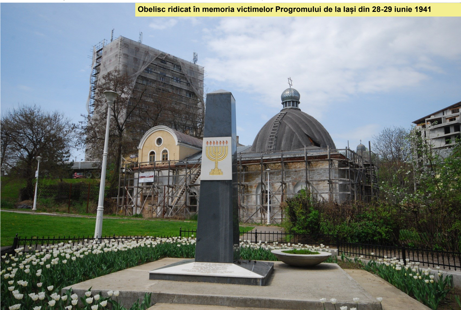
Obelisc ridicat în memoria victimelor Progromului de la Iași din 28-29 iunie 1941