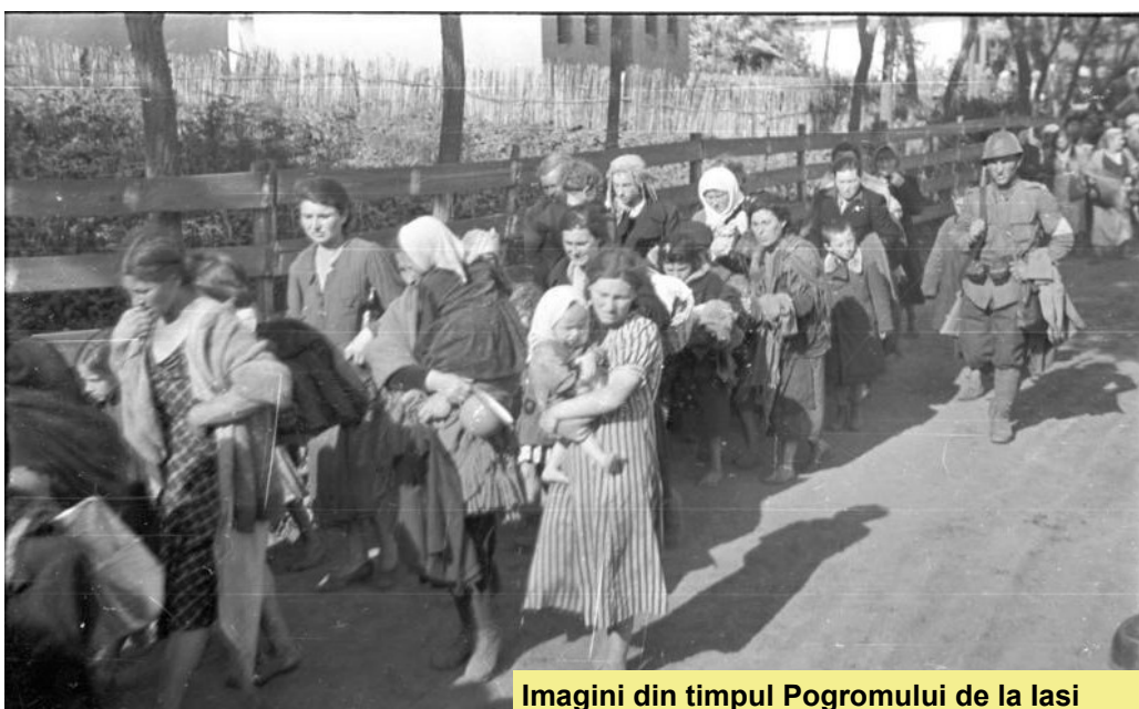
Imagini din timpul Pogromului de la Iași

Adolf Hitler (într-o declarație făcută unui jurnalist în 1922)